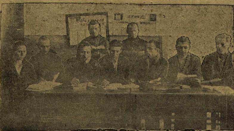
Районные курсы сельского руководящего актива.